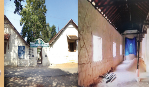
பள்ளியின் தற்போதைய தோற்றம்