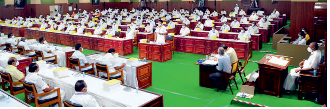
24.06.2021 அன்று சென்னை, கலைவாணர் அரங்கத்தில் நடைபெற்ற தமிழ்நாடு சட்டமன்றப் பேரவை கூட்டத்தில், மாண்புமிகு தமிழ்நாடு முதலமைச்சர் திரு. மு.க.ஸ்டாலின் அவர்கள், ஆளுநர் உரைக்கு நன்றி தெரிவிக்கும் தீர்மானத்தின் மீதான விவாதத்திற்கு பதிலளித்து உரையாற்றினார்கள்.