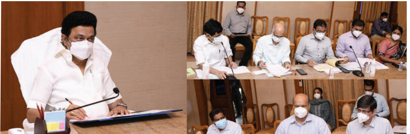
மாண்புமிகு தமிழ்நாடு முதலமைச்சர் திரு. மு.க.ஸ்டாலின் அவர்கள் தலைமையில் 29.06.2021 அன்று, தலைமைச் செயலகத்தில், உங்கள் தொகுதியில் முதலமைச்சர் துறையின் கீழ் பெறப்பட்ட மனுக்களுக்கு தீர்வு காண்பது குறித்த ஆய்வுக் கூட்டம் நடைபெற்றது. இந்தக் கூட்டத்தில், தலைமைச் செயலாளர், கூட்டுறவு, உணவு மற்றும் நுகர்வோர் பாதுகாப்புத் துறை கூடுதல் தலைமைச் செயலாளர், வருவாய் மற்றும் பேரிடர் மேலாண்மைத்துறை முதன்மைச் செயலாளர், ஊரக வளர்ச்சித்துறை முதன்மைச் செயலாளர், நில நிர்வாக ஆணையர், சமூக பாதுகாப்பு திட்ட ஆணையர், ஊரக வளர்ச்சித்துறை இயக்குநர், உங்கள் தொகுதியில் முதலமைச்சர் துறையின் சிறப்பு அலுவலர் மற்றும் அரசு உயர் அலுவலர்கள் கலந்து கொண்டனர்.