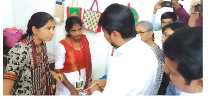
ஆகியவற்றின் விவரங்களைக் கேட்டறிந்தார்.

இந்நிகழ்வின் போது சக்கிமங்கலம் நரிக்குறவர் குழுவினரின் தொழிற்குழு உற்பத்திச் செய்த ஸ்படிக மாலை மற்றும் வாழ்ந்து காட்டுவோம் திட்டப் பயனாளர்கள் உற்பத்திச் செய்த சணல் பைகள், தென்னை கொட்டாங்குச்சி கைவினைப் பொருட்கள், மண்பாண்டங்கள் மற்றும் எண்ணெய் உற்பத்தி