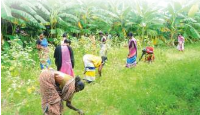
தமிழ்நாடு மகளிர் மேம்பாட்டு

ஏழை எளிய மகளிர் சுய உதவிக் குழு உறுப்பினர்களுக்கு குறைந்த வட்டி விகிதத்தில் வங்கி கடன் வழங்கும் பொருட்டு, ரூ.3.00 இலட்சம் வரையிலான கடன்களுக்கு வட்டி மானியம் வழங்கப்படுகிறது. 2021-22ம் ஆண்டில், 1,62,069 சுய உதவிக் குழுக்களுக்கு 27.12 கோடி ரூபாய் வட்டி மானியமாக விடுவிக்கப்பட்டுள்ளது.