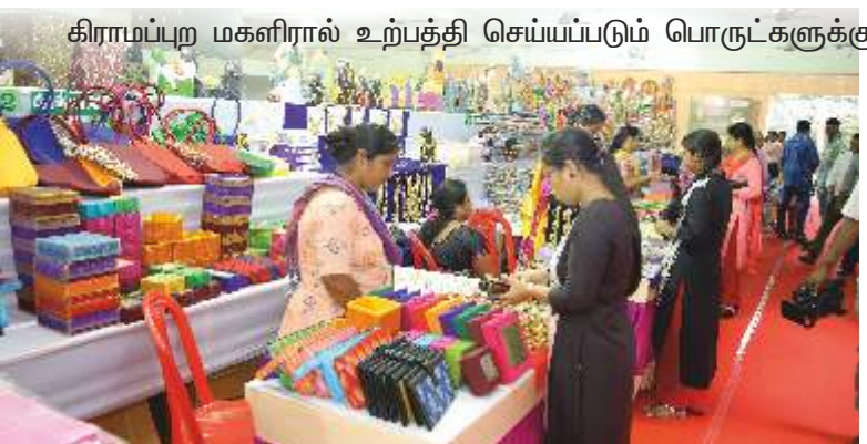
கிராமப்புற மகளிரால் உற்பத்தி செய்யப்படும் பொருட்களுக்கு

தேவையும், சந்தை வாய்ப்புகளும் அதிக அளவில் உள்ளன. இந்த வாய்ப்புகளைப் பயன்படுத்தி, சந்தைப்படுத்துதலை மேம்படுத்த விற்பனை வளாகங்கள் அமைத்தல், மதி அங்காடிகள் மற்றும் கண்காட்சிகள் நடத்துதல் ஆகியவற்றை மேற்கொள்வதோடு, சந்தை நுண்ணறிவு, பொருட்களின் ஆய்வு, மதிப்புக் கூட்டல் போன்ற பல்வேறு நடவடிக்கைகளையும் தமிழ்நாடு மகளிர் மேம்பாட்டு நிறுவனம் மேற்கொண்டு வருகிறது.