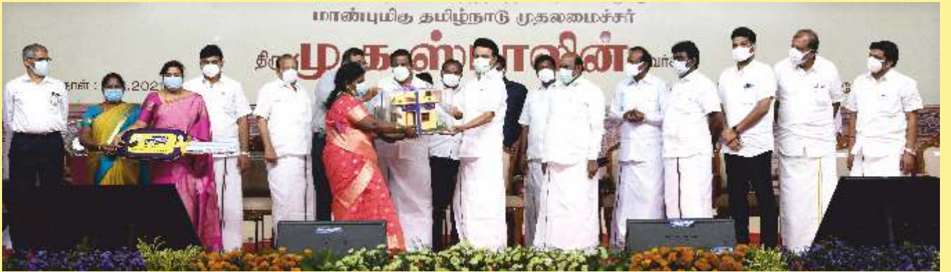
மாண்புமிகு தமிழ்நாடு முதலமைச்சர் திரு. மு.க.ஸ்டாலின் அவர்கள் 11.12.2021 அன்று சேலம் மாவட்டம், சீவநாயக்கன்பட்டியில் நடைபெற்ற அரசு விழாவில், பயனாளிகளுக்கு நலத்திட்ட உதவிகள் வழங்கினார்.