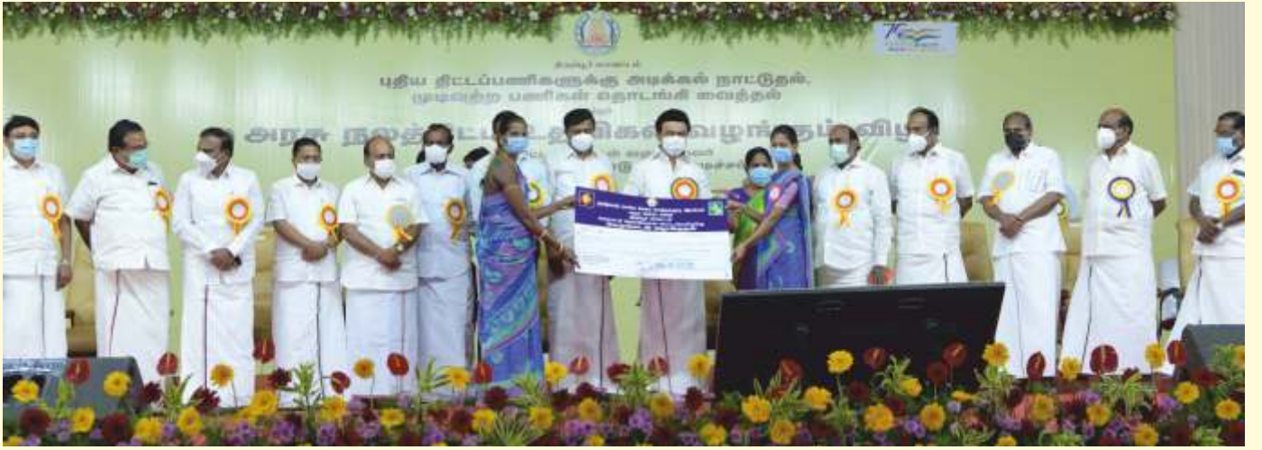
மாண்புமிகு தமிழ்நாடு முதலமைச்சர் திரு. மு.க.ஸ்டாலின் அவர்கள் 22.11.2021 அன்று திருப்பூர், சிக்கண்ணா அரசு கலைக் கல்லூரி வளாகத்தில் நடைபெற்ற அரசு விழாவில், பயனாளிகளுக்கு நலத் திட்ட உதவிகளை வழங்கினார்.